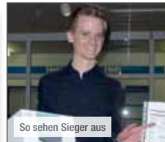
So sehen Sieger aus

litik bei Harms & Wende GmbH & Co. KG sondern auch unser Spieleabend, der jedes Jahr im November vom Festausschuss in gewohnt souveräner und guter Art und Weise organisiert wird. Nach dem obligatorischen Grüncokhlessen geht es ans „Zocken“. Ne-