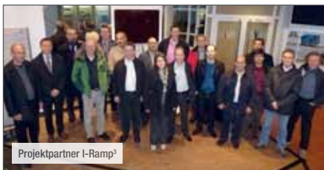
Projektpartner I-Ramp 3

In I-RAMP 3 werden wissenschaftlich spannende Themen behandelt, die direkte Auswirkungen im industriellen Umfeld haben werden.