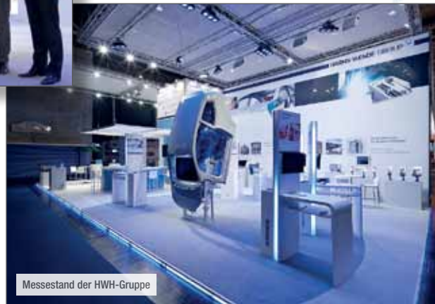
Messestand der HWH-Gruppe

und Schutzgasschweißverfahren von unserem Tochterunternehmen HWH-QST GmbH. Eine weitere Station zeigte die Automatisierungslösungen um das Schweißsystem Sinius und um das technische Wärmen. Diese Station der Marke Procon PAS präsentierte die Nutzen für die Automatisierung von Prozessen. Unsere Inverter der Serie Genius mit adaptiver Regelung IQR und die bedienerfreundliche und innovative Oberfläche XPegasus 3.0 für automa-