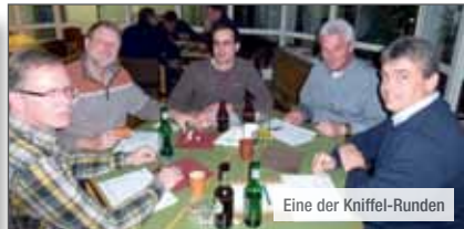
Eine der Kniffel-Runden