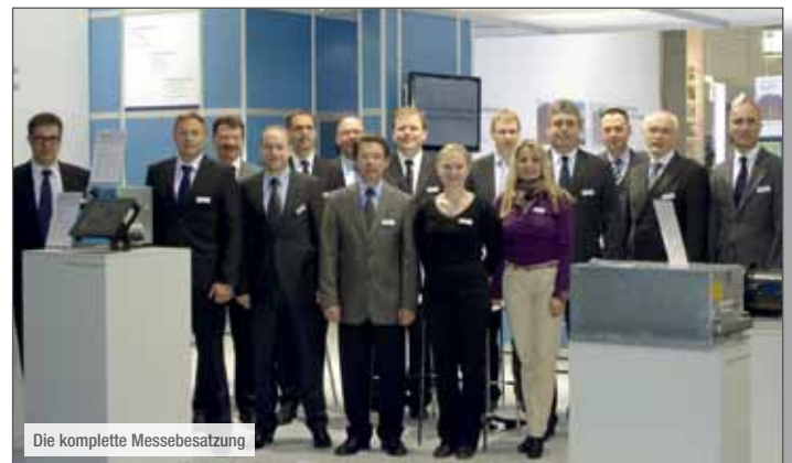
Die komplette Messebesetzung