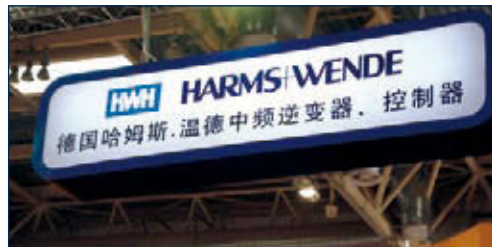
Harms & Wende in China

Fünf Jahre Partnerschaft – eine starke Beziehung feiert Geburtstag.